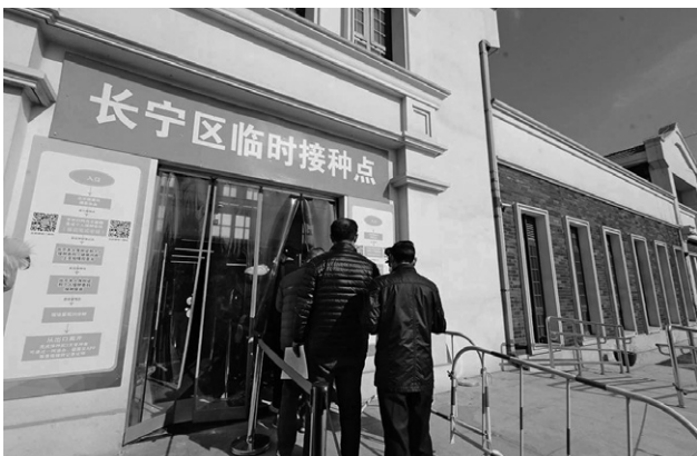
接種施設の1つ「長寧区臨時エリア」

接種は、対象となる人達の働く職場が接種人数や予約等を自主的に行い、今年2月5日前に完了する予定です。