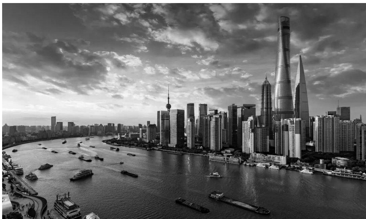
上海市「浦東&外灘」の景色