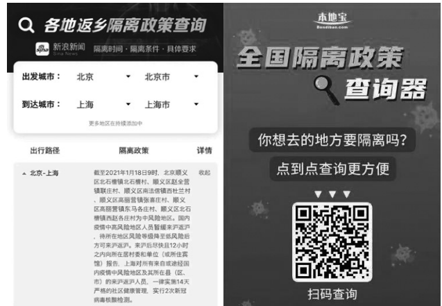
全国隔離政策查詢器 画像出所：筆者携帯アプリ画面 ※3

都市情報のプラットフォーム「本地宝」の新サービス「全国隔離政策查詢器」は、出発地と目的地を入力するだけで、行き先の都市が行っている最新の隔離政策の確認が可能です。