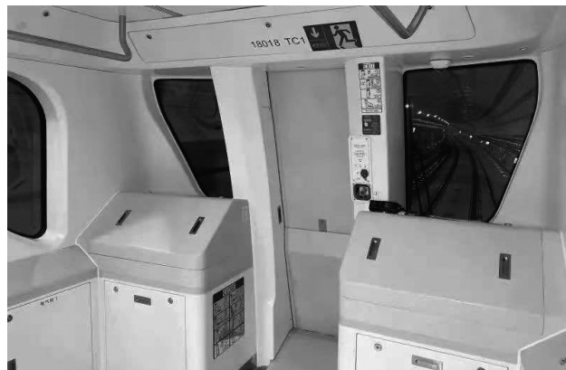
地下鉄車内

自動運転車両が採用される予定で、既に14、15号線への投入が決まっています。また、保有車両数は2020年12月末現在、7,000両に達し、営業距離(729km)、保有車両数ともに世界一となりました。