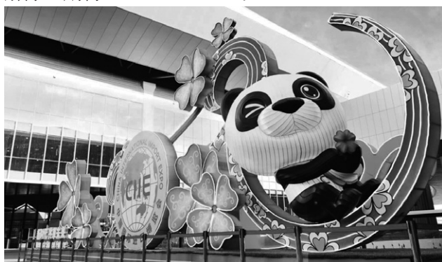
第3回中国国際輸入博覧会会場

2011年3月の福島第一原子力発電所事故以降、中国では「10都県規制」（農水産物、加工食品等の輸入規制）を続けていますが、東日本大震災から10年が経過することを節目に、規制を緩和してもらいたいとの動きがみられています。ぜひ早期解除を期待したいところです。